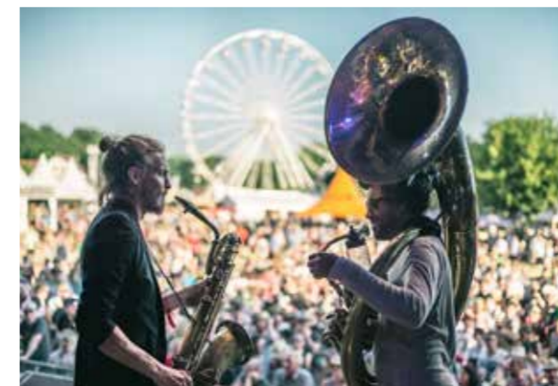
Woodstock der Blasmusik